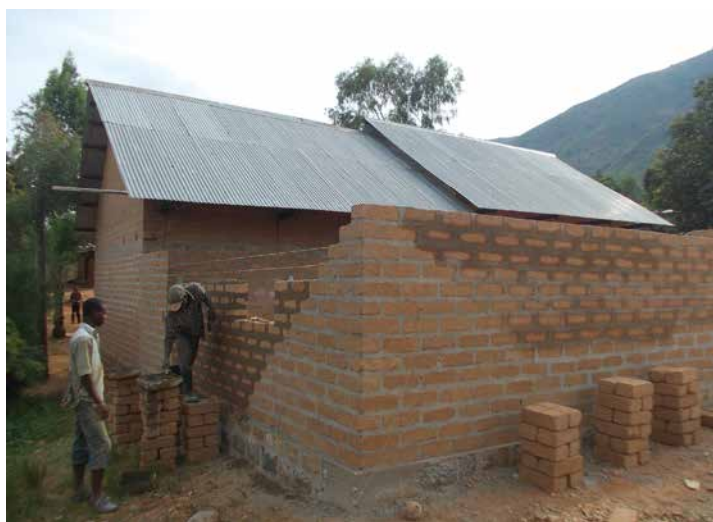
Construction de la 3 e classe avec les briques BTCS

L'école de Rugembe est une école de "rattrapage", l'école de la dernière chance gérée par ASEJV (L'Action Sociale pour l'Encadrement des Jeunes Vulnérables), où les enfants les plus pauvres peuvent avoir accès à l'enseignement, car les frais scolaires sont nettement inférieurs aux autres écoles.