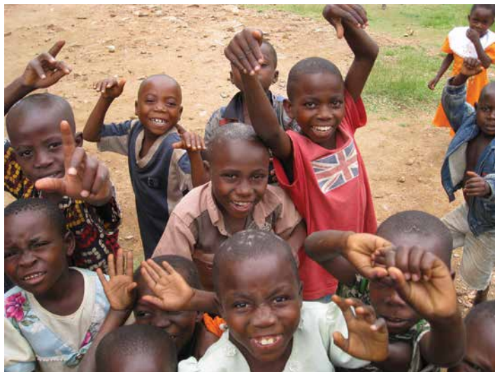
462 élèves sont financés cette année par ERC

Il faut noter qu'une action générale dans le domaine scolaire n'entre pas dans les missions que nous nous sommes