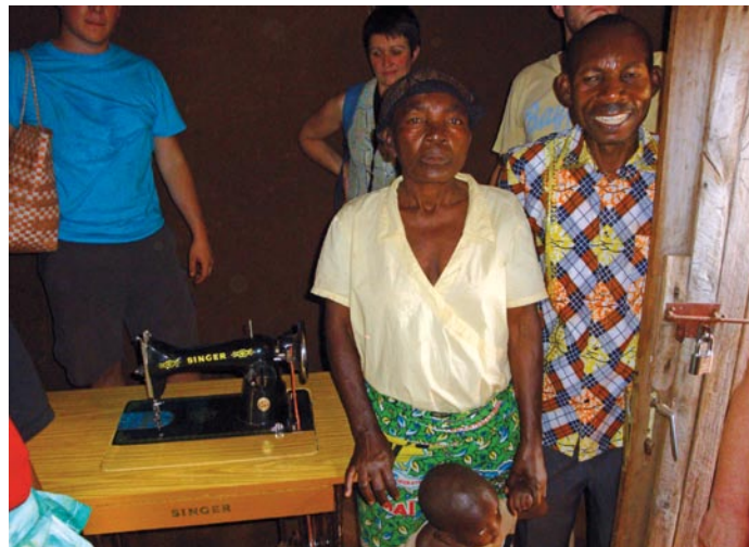
L'atelier de couture de Makobola

et une participation effective des Mamans à cette gestion. Aujourd'hui, les veuves de Makobola ont élu leur comité de gestion où elles sont majoritaires. Elles ont aussi tenu à intégrer dans le projet les ex enfants soldats qui se sont impliqués en fournissant le sable et les moellons pour la construction du bâtiment. Le moulin acheté chez Declerck-Bexen en Belgique pour assurer l'approvisionnement en pièces de rechange est en route pour le Congo.