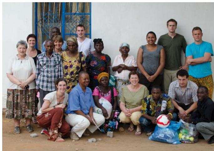
Des membres d'Espérance Revivre au Congo rencontrent nos partenaires de Matumaini Kuishi Congo

LETTRE D'INFORMATION D'ESPÉRANCE REVIVRE AU CONGO ASBL 45, rue du Culot - 1341 Céroux - Mousty 010 / 61 60 87 - www.espereco.be