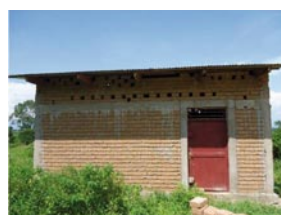
Le nouveau bâtiment de la coopérative et la nouvelle décortiqueuse de riz