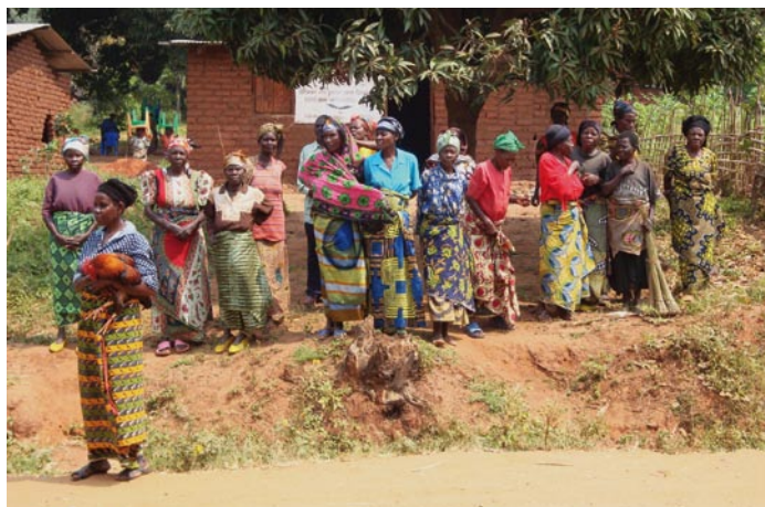
Les femmes veuves de Makobola

Le soutien décisif de la Province du Brabant Wallon et du Conseil Consultatif Nord-Sud de Nivelles qui ont cofinancé le projet de moulin à manioc de Makobola relance une dynamique communautaire sur laquelle d'autres micro-projets pourront se greffer. Le projet a été initié par le groupe de Mamans veuves qu'Espérance Revivre au Congo soutient depuis l'odieux massacre commis dans ce village à la Saint-Sylvestre 1998. Il aura pourtant fallu près de cinq ans pour que le chantier du moulin communautaire se concrétise. Il a été examiné et réexaminé maintes fois par notre commission "projets" et par notre partenaire Matumaini Kuishi Congo. Son démarrage très tardif résulte du souci que nous nous faisons tous d'assurer un mode de gestion approprié qui garantisse une autonomie rapide